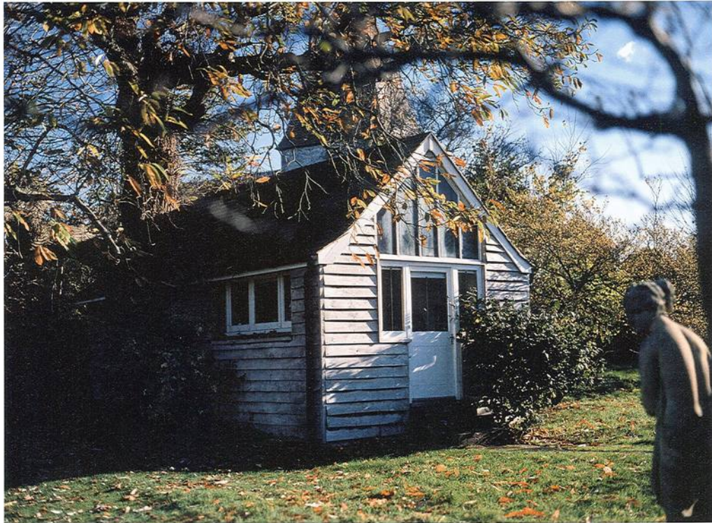
Cabaña de Virginia Woolf en Rodmell, Gran Bretaña

Daniel Defoe, en la construcción literaria de la cabaña de Robinson Crusoe escrita en 1719, prefiguraba ese ideal: la rudimentaria morada aislada de lo civilizado, refugio de un solitario ocupante (p. 84). La rudeza de la cabaña es el abandono de lo superfluo, la aceptación de una "transfiguración de lo cotidiano desde una absoluta humildad" (p. 27) que implica asumir la total reconfiguración de la propia concepción del ser. Thoreau o Heidegger, como dos ejemplos posibles de esta entrega plena a las energías vivas de la naturaleza en la que la masa del cuerpo del individuo (condicionado por la severidad de esa escogida vida austera) se convierte más intensamente en el cauce de experiencia para el espíritu y el alma y en la que, tal vez, pueda argüirse la metáfora del cuerpo como arquitectura. Endurecidos en esa "autodisciplina violenta" (en palabras de Nietzsche), la estructura del cuerpo y su recubrimiento de piel se convierten en las primeras referencias orgánicas para entender la rudeza ideal de la cabaña